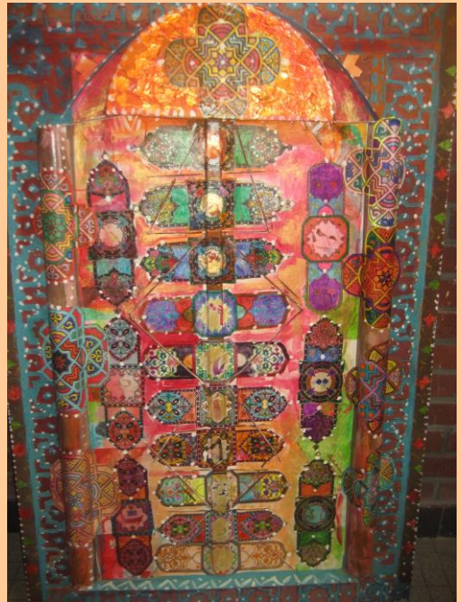
Tableau réalisé dans le cadre des Ateliers d'Animation Interculturelles du Centre ALCO, à l'Ecole Elémentaire « La Paix »

375 enfants et 74 parents ont pu bénéficier de ces activités.